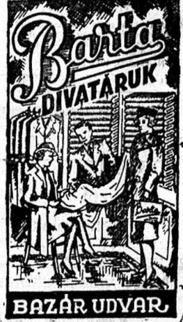
Legszébbet a legolcsóbban

Szerencsére nem a kanizsai tár-szégéből, hanem a szombathelyiből való az itt következő hír, amit a Vasvármegyei c. lapjaink ardhir-velés rovatában olvastunk, szöze-rint úgy, ahogyan itt következik: »Felszólalom azon hölgyet, ki az el-múlt héten szatonon vírinjéből egy darab csiztidét véletlenül magánál vitt és eddig vissza nem hozott, ha 8 napon belül postára vagy más úton vissza nem juttatja, megteszem el-lene a feljelentést, minthogy a be-mélybire vonatkozó biztos adatok hi-tyokban vagyok. Ujlyenomataim vannak.»